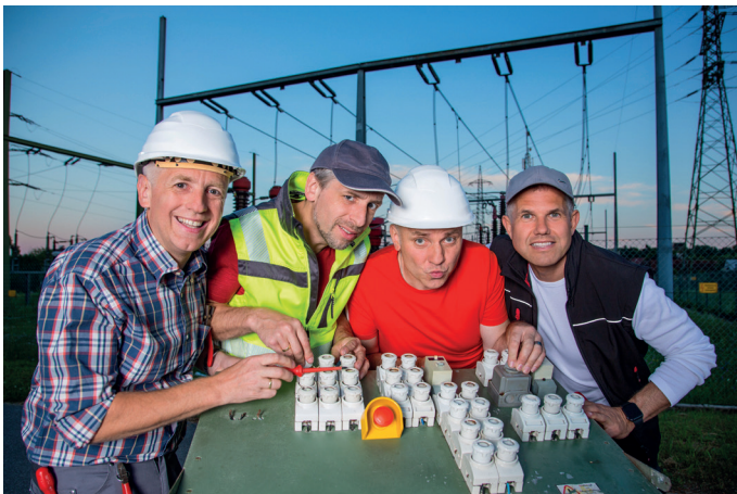
Die Vierkanter

Und so halten sie uns dabei mit Augenzwinkern und pointiert-hintergründigen Texten den einen oder anderen Spiegel vor.