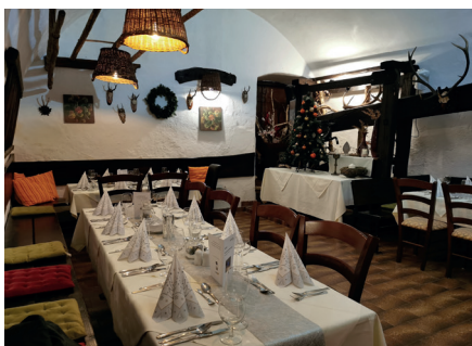
Hotel Höllrigl

Zur gemütlichen Einstimmung wurde ein heißes Begrüßungsgetränk bei interessanten Gesprächen im festlich geschmückten Hof des Tennis Golf Hotel Höllrigl angeboten. Der vorweihnachtliche Festgottesdienst wurde von Pfarrer Walter Reichel zelebriert.