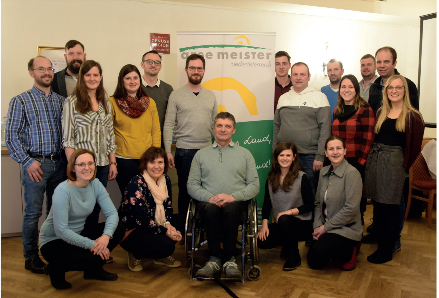
Meisterbeirätinnen und Meisterbeiräte

ten Funktionärinnen und Funktionäre am Programm. Danach waren die Hauptthemen der Klausur die Gestaltung der Zusammenarbeit untereinander, sowie die Jahresarbeitsplanung der ARGE Meister NÖ.