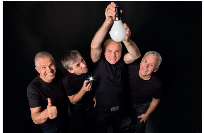
Die Vierkanter

Obwohl DIE VIERKANTER auf der Bühne praktisch kurz vor der „Silbernen“ stehen und auch so manches „outsch“ schon zwicken könnte, ist die Frage nach der „a cappella-Midlife-Crisis“ völlig unangebracht! Sie beweisen im neuen Programm genau das Gegenteil und (er)finden sich sozusagen immer wieder neu!