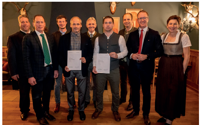
Beste Meister aus Niederösterreich mit Ehrengästen

land- und forstwirtschaftliche Jugend dar. Ich gratuliere allen Preisträgerinnen und Preisträgern zu ihren Spitzenleistungen, die uns trotz schwieriger Zeiten mit Optimismus erfüllen.“