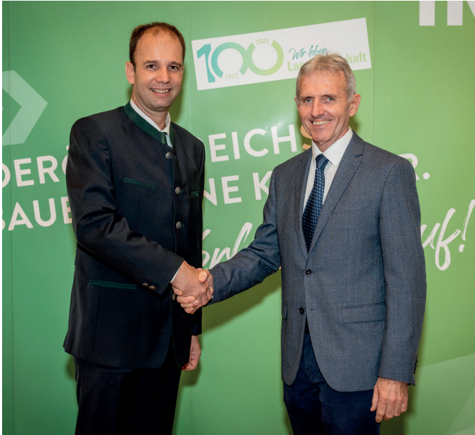
Obm. Boigenfürst und GF Wimmer

gen-Veranstaltung in Zeillern und das Benefizkabarett. Webinare wurden zu einigen Themen angeboten, wie „Auswirkung von GAP/ÖPUL 2023 auf die landwirtschaftlichen Betriebe“, „Green Deal - Wohin geht die europäische Landwirtschaft?“, „Steigende Düngerpreise – Wie geht es weiter?“ und „Agrarbildung und Beratung für Berufspraktiker*innen“. Es wurde wieder eine Meisterinnenexkursion in die Steiermark, eine Weinviertel-exkursion und eine Weinbaumeister*innenexkursion angeboten. Landwirtschaftliche Fachexkursionen gab es nach Sizilien und nach Norddeutschland. Erstmals in der Geschichte der Leopold Figl-Stipendien erhielten auch land- und forstwirtschaftliche Meister*innen ein Sti-