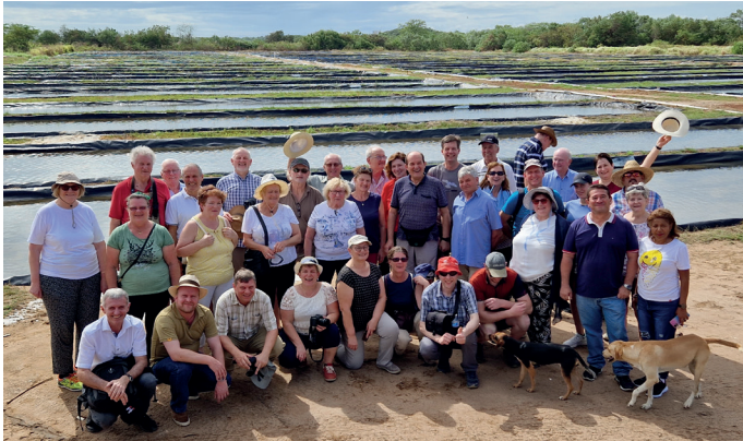
Meister*innen aus NÖ, Salzburg und Steiermark bei Salzgewinnung

heißt die Kindergeschichte von Janosch und beschreibt, wie der kleine Tiger und der kleine Bär nach Panama, in das Land ihrer Träume, reisten. 36 Meister*innen aus NÖ, Salzburg und der Steiermark wollten sich bei einer Meister*innenexkursion selbst ein Bild davon machen.