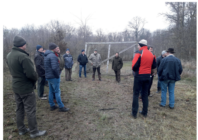
interessierte Teilnehmer